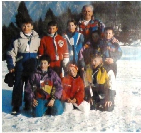
14 FEBBRAIO 1999 - DOMODOSSOLA - LA RINASCITA DEI RIMARRI

macugnaga - m. moro 1° Trofeo Comune di Malnate Lo Sci-Cai Malnate organizza per l'11 APRILE p.v. (Lunedì dell'Angelo) una gara di Slalom Gigante denominata "1° TROFEO COMUNE DI MALNATE", che si svolgerà sulle piste del M. MORO. Tale gara è suddivisa in 3 Categorie: SENIORS MASCHILE, JUNIORS MASCHILE, FEMMINILE ed ha CARATTERE PROVINCIALE. La stessa è infatti aperta a tutti i Tesserati F.I.S.I., iscritti a qualsiasi Società con Sede in Provincia di Varese. Vige pertanto il Regolamento F.I.S.I. (Federazione Italiana Sport Invernali), sotto la cui epigrafe tale manifestazione sciistica avrà svolgimento. I giudici di gara saranno quindi designati dalla F.I.S.I. medesima, mentre il servizio di cronometristi verrà curato dalla Federazione Italiana Cronometristi. Oltre al magnifico Trofeo "Comune di Malnate", offerto dall'Amministrazione Comunale cittadina, saranno posti in palio numerose coppe e medaglie. Il regolamento di gara, nonché le modalità della relativa effettuazione e lo elenco dettagliato dei premi, saranno pubblicati su un ricco "depliant" illustrativo che sarà fornito agli interessati dalla Segreteria dello Sci-Cai Malnate. Le prenotazioni e le iscrizioni si ricevono presso la Sede del CAI nelle sere di Martedì, Mercoledì e Venerdì dalle ore 21,15 alle 23. La premiazione dei vincitori avverrà nel corso di una serata all'Uopo allestita. Maggiori informazioni verranno pubblicate sulla locale stampa, la settimana precedente.