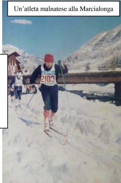
Un'atleta malnatese alla Marcialonga

I neonati Ramarri (o Sghezz in dialetto) si dotarono fin da subito di un distintivo, di una divisa sociale (maglione blu con riga rossa sul braccio sinistro) e di un inno.